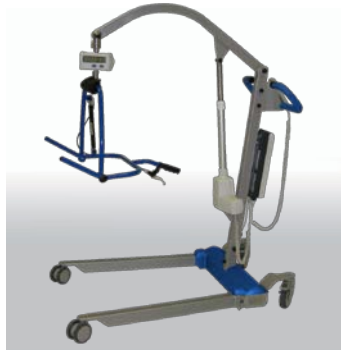
Levier sur toile avec système DPS