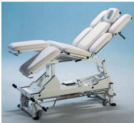
Table de traitement à ajustements multiples.