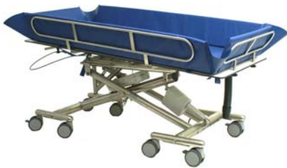
Civière-douche bariatrique, capacité de 600 livres, largeur de 39 pouces

Une gamme complète de solutions pour les personnes à mobilité réduite