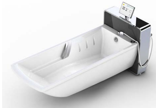
Baignoire à hauteur variable Phoenix, avec cuve ergonomique unique pour un meilleur confort et une hygiène plus facile.