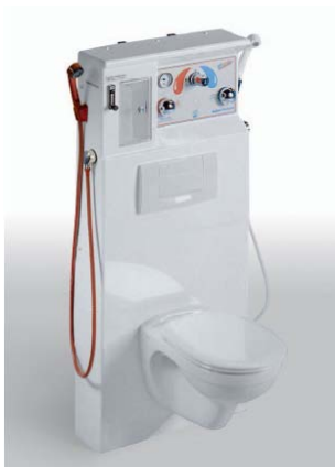
Console de douche avec toilette