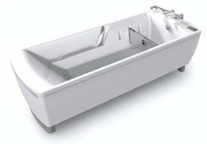
Bain à hauteur variable Avero