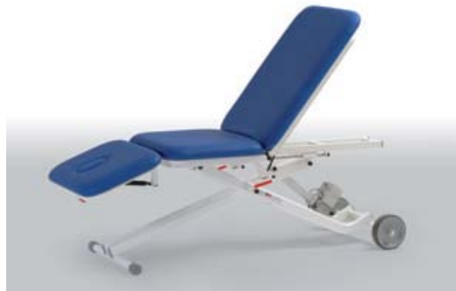
Table de traitement à 3 sections et hauteur variable.