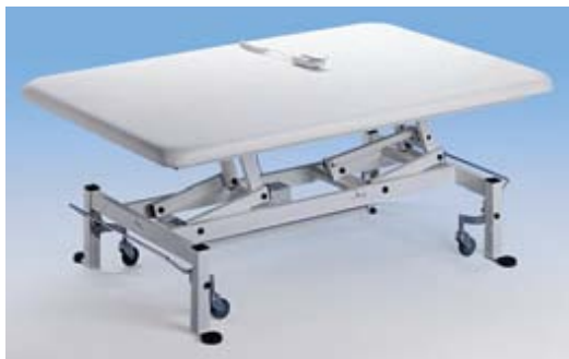
Table de traitement à grande surface. Disponible avec hauteur variable et nombreux accessoires.

Civière multifonctions pour le transport ou le traitement des patients. Différents ajustements possibles et système de hauteur variable (électrique ou hydraulique). Nombreux accessoires possibles en fonction des besoins spécifiques. Équipements résistants et très confortables.