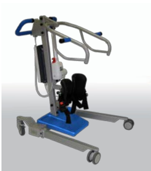
Levier à station debout