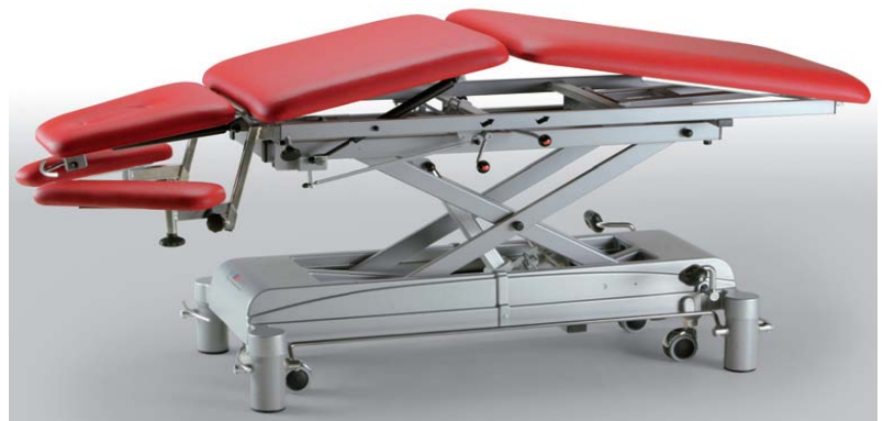
Table de traitement à ajustements multiples.

AQUAelectronik Technologies Inc. 1140, rue Neveu, Saint-Césaire (Québec) J0L 1T0 Téléphone: 1-800-442-2246, Télécopieur: (450) 469-0368 info@aquaelectronik.ca www.aquaelectronik.ca