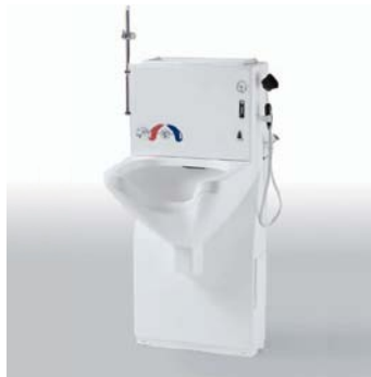
Console d'hygiène pour stomie