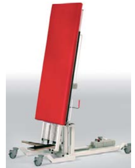
Table de réhabilitation à inclinaison variable.